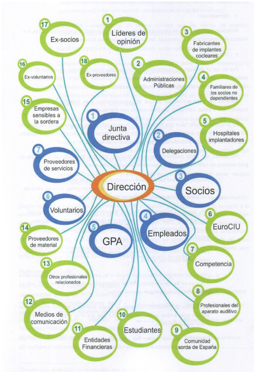
Organigrama de Actuación (Texto de la Imagen)

Escrito por Federación AICE Jueves, 01 de Marzo de 2012 12:32