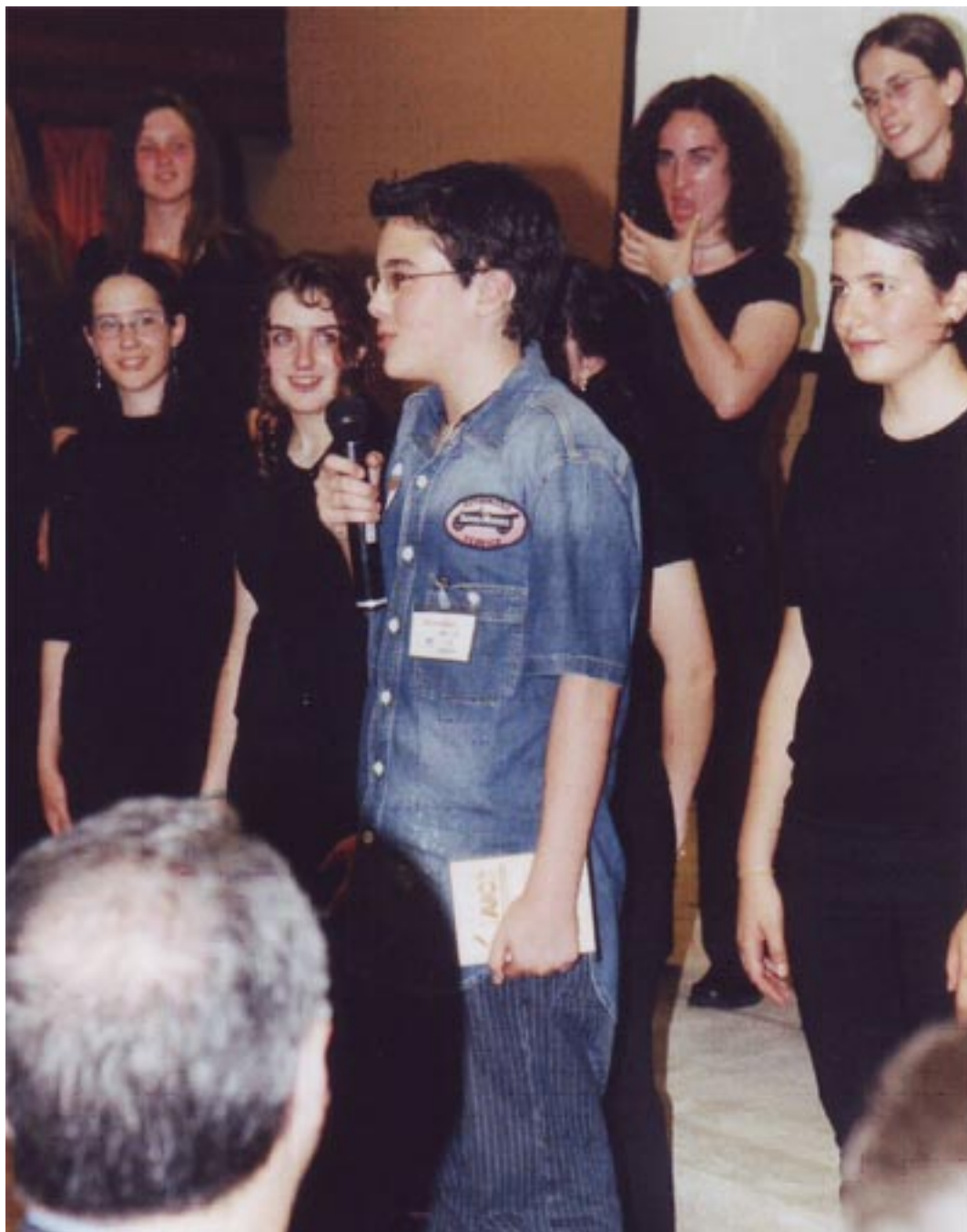
Joven implantado de 14 años por ser un soplo de aire fresco y juvenil en la lista de Implante Coclear, de